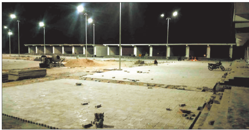
नवनियमित थोक सब्जी मण्डी।

कंपनी बाजार में वर्षों से संचालित थोक सब्जी मंडी अब अव्यवस्था का शिकार हो गया है। शहर के घनी आबादी के बीच संचालित सब्जी मंडी में आए दिन जाम की स्थिति निर्मित होने से न केवल किसानों एवं दूर-दूर से आने वाले सब्जी विक्रेताओं बल्कि मंडी में कारोबार करने वाले व्यापारियों को भी भारी समस्या का सामना करना पड़ रहा है। मंडी में जिलेभर के किसानों द्वारा उत्पादित सब्जियों एवं खरीददारों की भारी भीड़ उमड़ने के कारण अब मंडी छोटी पड़ रही है। थोक सब्जी मंडी में